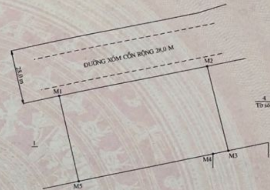
BẢNG KÊ TOẠ ĐỘ VÀ KHOẢNG CÁCH (Hệ tọa độ VN-2000)